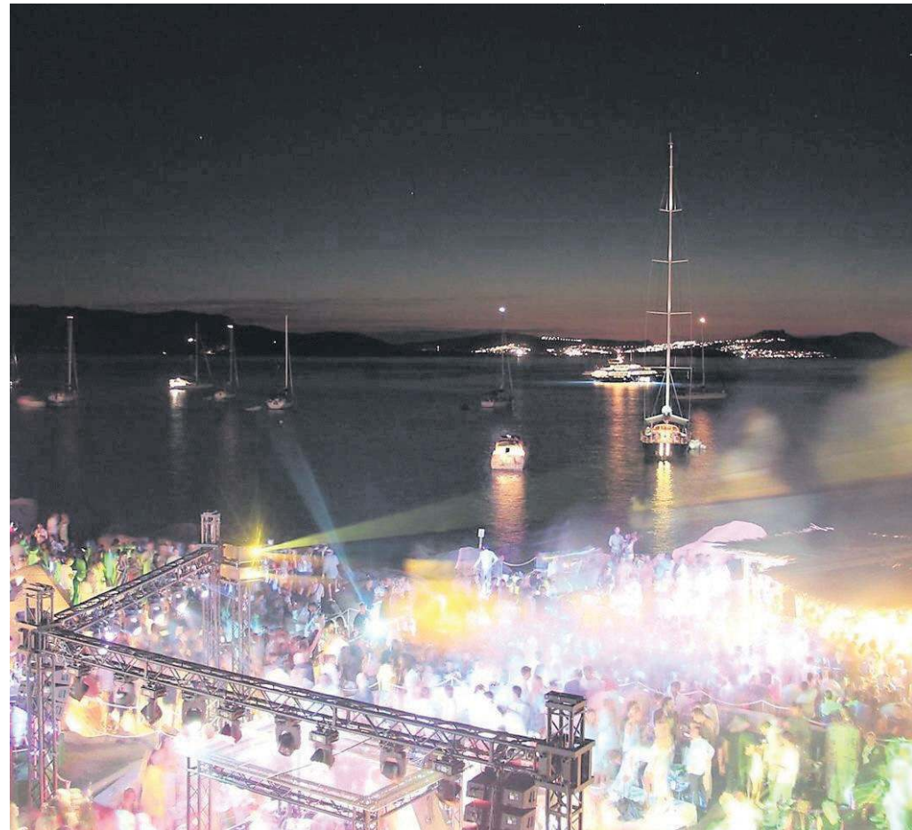
Una suggestiva immagine al tramonto del Phi Beach di Baja Sardinia

Così si spiega l'ingorgo di "Star" del mondo dj che hanno manovrato la consolle in questa