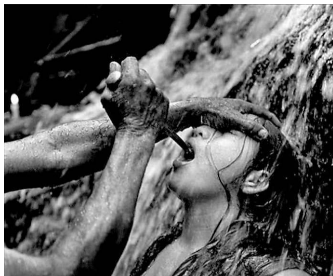
Un rito contro gli spiriti maligni in Venezuela

Dopo l'inaugurazione di "Con la boca abierta" Cristina Garcia Rodero ha presentato il suo lavoro durante un incontro pubblico dal titolo "Riflessioni sull'etica di un mestiere". Abbiamo chiesto alla fotografa spagnola, unica donna del suo paese a far parte della prestigiosa agenzia Magnum, come le sia venuta l'idea di lavorare sul tema della mostra. «È nato tutto da una fotografia che ho scattato nel 1979 in Galizia, in occasione di una festa religiosa, La Romeria de Nuestra Señora de